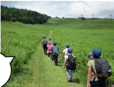
美しい風景の中での登山。

5年生の林間学校を7月22日（火）、23日（水）に実施しました。所沢市に比べると涼しいはずの高原ですが、今年は少し暑かったようです。でも子どもたちは、登山やキャンプファイヤー等、普段できない学習を通して、忘れられない思い出を作ることができました。