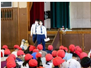
〈自転車免許講習会〉

5月24日（水）に、校庭で交通安全教室を行いました。全学年の児童が交通安全のルールやマナーについて学びました。また、4年生は所沢警察署の方から自転車免許講習を受け、学科試験も行いました。いざという時に、大切な命を守ることができるよう、学んだことを日頃の生活の中で生かしてほしいです。