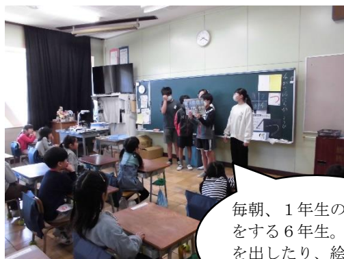
毎朝、1年生のお世話を する6年生。クイズ を出したり、絵本を読 んだりしています。