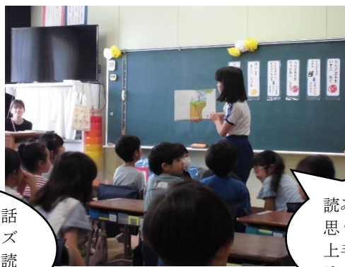
読み聞かせのプロかと思 う6年生も。本当に 上手で1年生もうれし そうに聞いています。